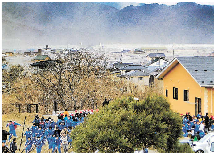
「釜石の奇跡」。東日本大震災で、岩手県釜石市の小中生は99・8％が避難し無事だった。防災教育のたまものと、新聞やテレビが報じ、書籍化もされたことから広く知られる。