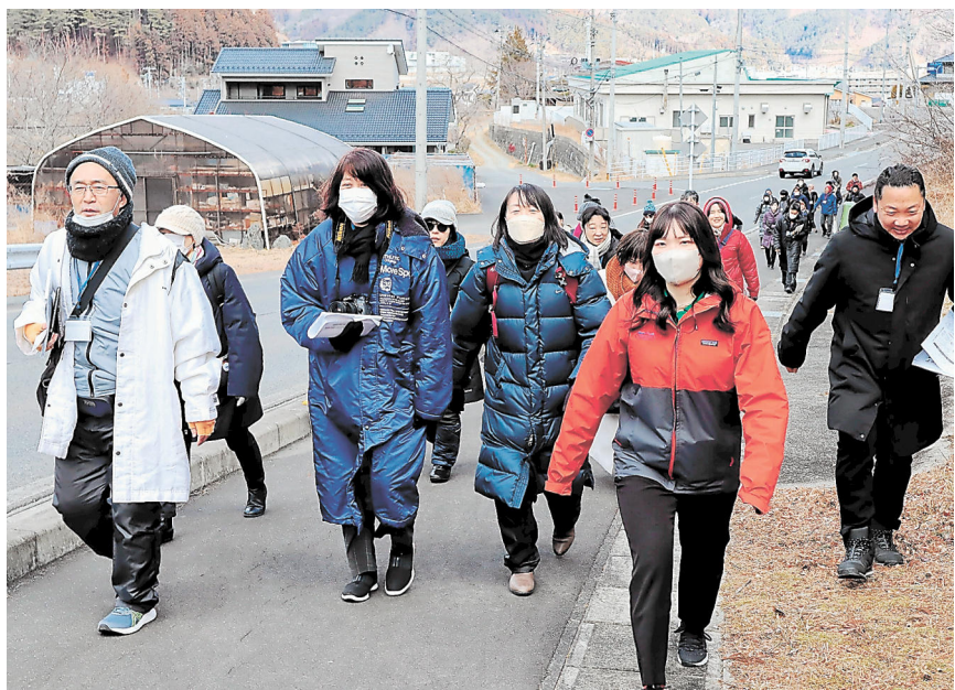
約570人の児童生徒が被災した市立釜石東中と市立鶴住小は、海から約5

3・11教訓伝承・被災地視察研修 宮城教育大防災教育研修機構が2019年度、南海トラフ巨大地震など全国の災害警戒地域の教職員を対象に始めた。岩手県と宮城県の東日本大震災被災地を巡り、元教諭や語り部との対話を通じ、主に学校現場での教訓を学び、防災教育のあり方を考える。研修10回目は今回は2月21・24日、23都道府県から35人が参加して行われた。通算で39都道府県の計280人が参加している。